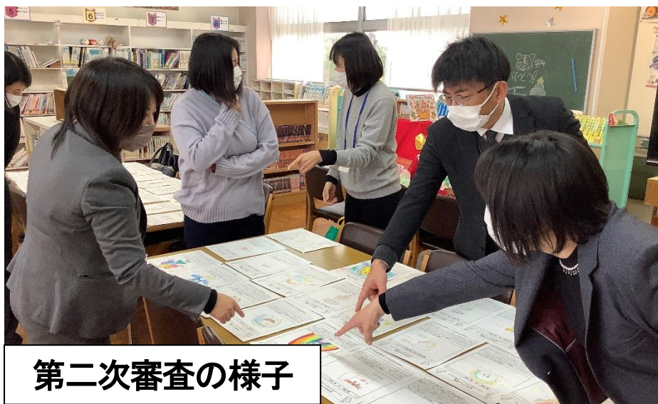
第二次審査の様子